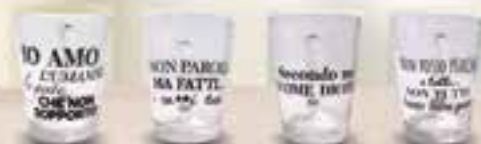
TAZZA CON FRASI ASSORTITE

SCONTRINO UNICO - salvo esaurimento scorte