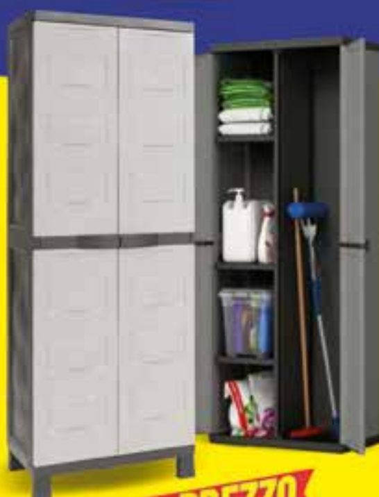
MOBILE AMBITION MIDI PORTA SCOPE 65X37XH173 CM