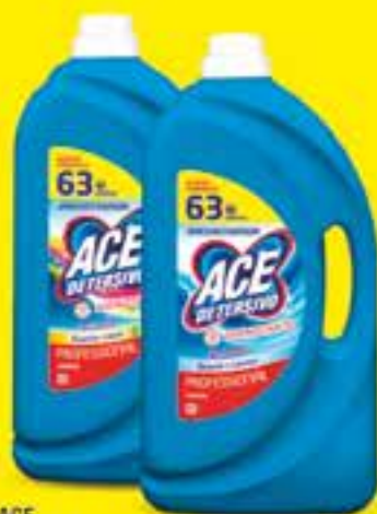
ACE PROFUMA LAVATRICE COLOR/CLASSICO X 63 LAVAGGI