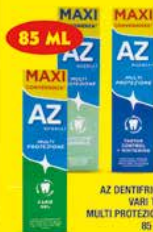
AZ DENTIFRICIO VARI TIPI MULTI PROTEZIONE 85 ML