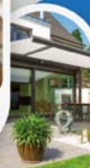
TENDE DA SOLE ZANZARIERE DI OGNI TIPO