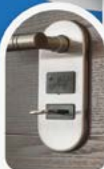
LAVORAZIONI IN FERRO (Persiane, grate, combinato, ecc)