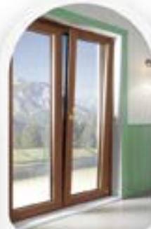
FINESTRE IN PVC ED ALLUMINIO