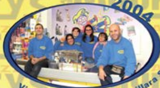
2004 Via Anguillarese, 115 Anguillara S. (Rm)