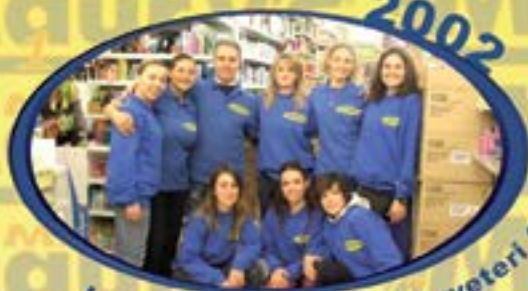
2002 Largo Almunecar, 20 Cerveteri (Rm)