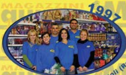
1997 Via Palermo 21 Ladispoli (Rm)

DETERSIVI - PROFUMERIA - CASALINGHI GIOCATTOLE - ELETTRODOMESTICI - CARTOLERIA