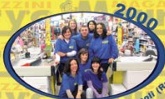
2000 Via Glasgow 60 Ladispoli (Rm)