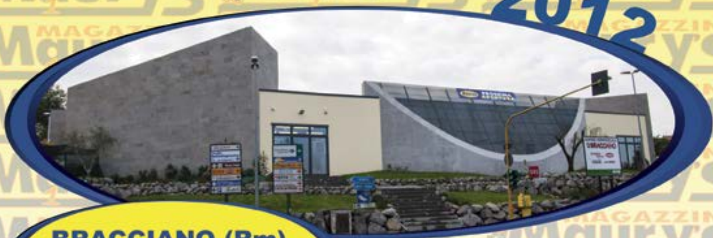
BRACCIANO (Rm) Via A. Perugini, 1