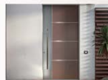
Ponzio 100 Portone in alluminio blindato