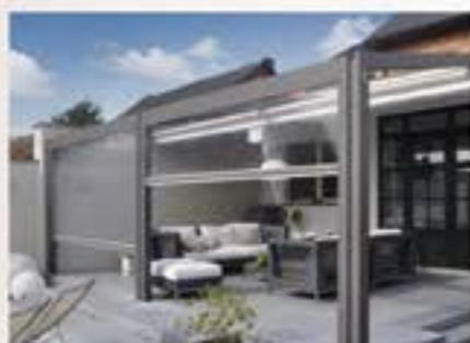
Tende da sole Pergotende

INFISSI E PERSIANE IN ALLUMINIO ANTIEFFRAZIONE RC3