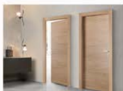
Porte in legno