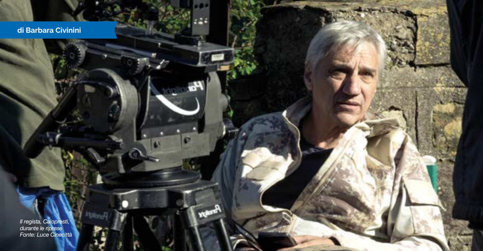
Il regista, Calopresti, durante le riprese