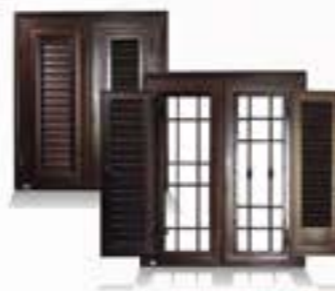
Lavorazioni in ferro