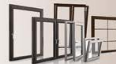
Infissi in alluminio e alluminio-legno