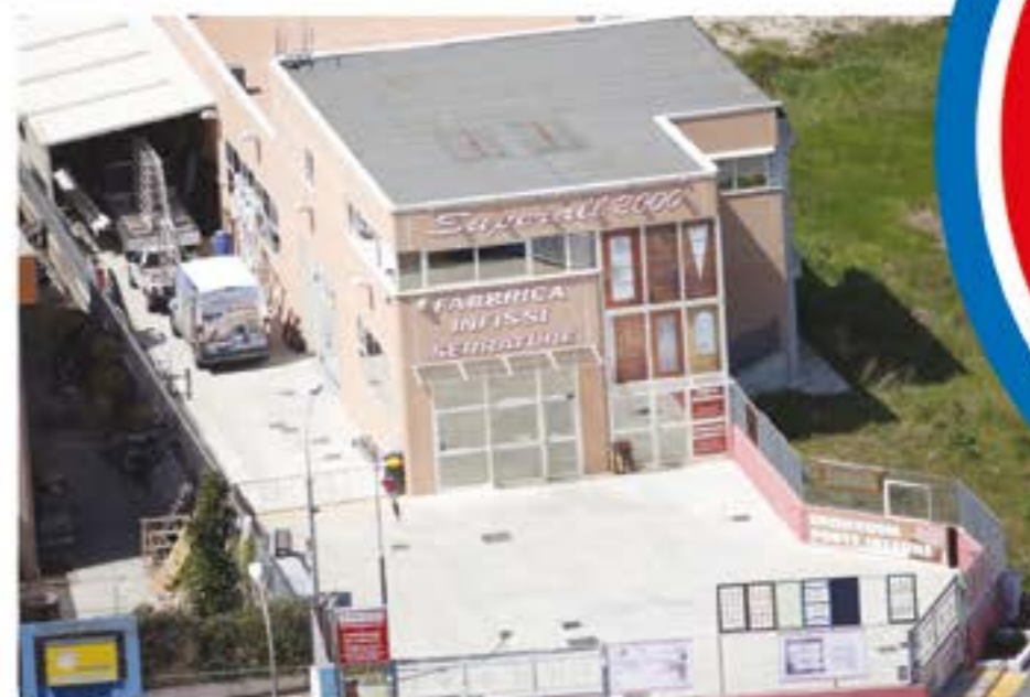
PERGOTENDE PERGOLE TENDE FRANGISOLE