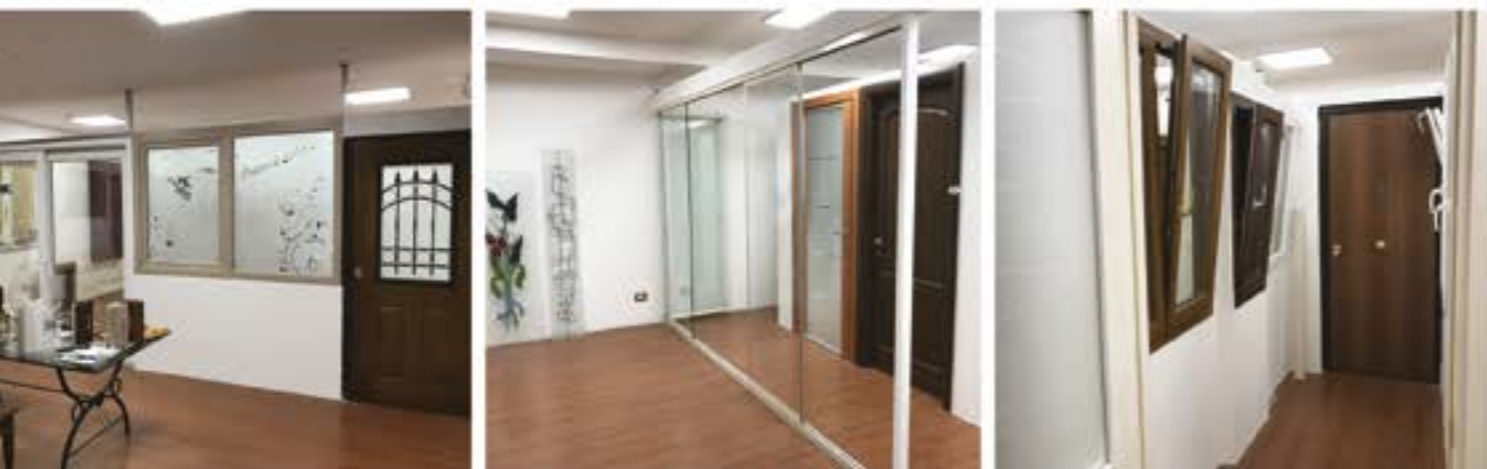
PORTE BLINDATE - INFERRIATE BLINDATE - PERSIANE BLINDATE - CANCELLI IN FERRO