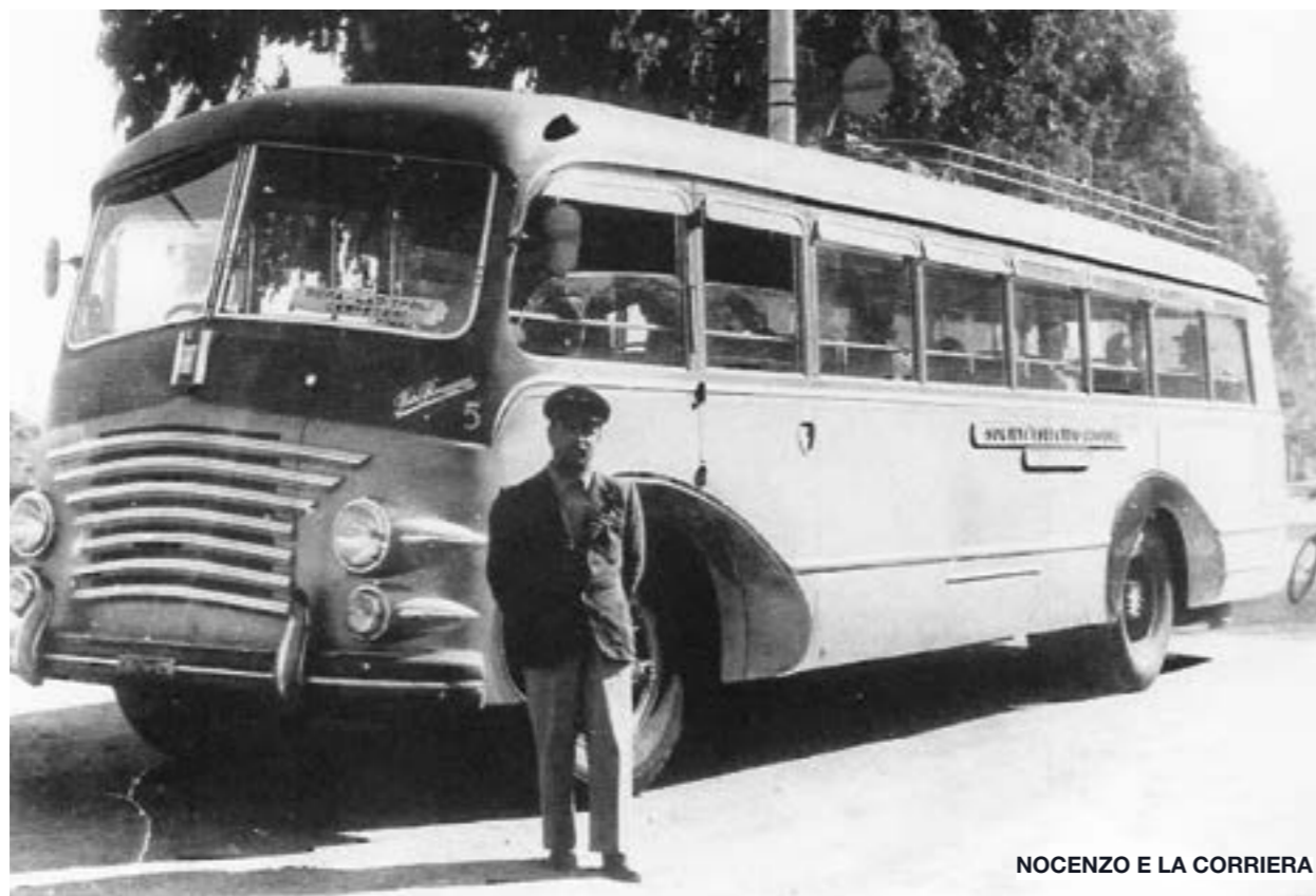
NOCENZO E LA CORRIERA