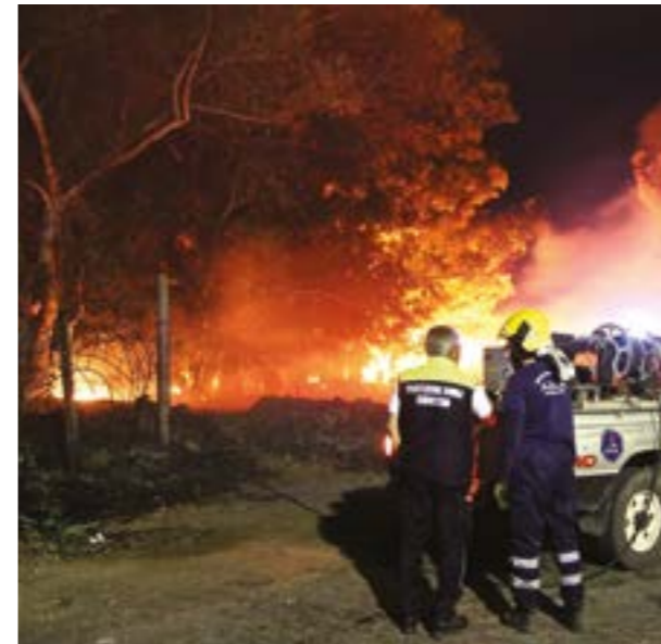
CAMPO DI MARE

to che esista una regia occulta, insieme all'acre fumo che da giorni si respira a Ladispoli, abbiamo la grave sensazione che la città sia sotto attacco. Un attacco studiato a tavolino, preparato minuziosamente, con il chiaro obiettivo di colpire i simboli di Ladispoli. Perché il bosco di Palo Laziale e la palude di torre Flavia sono i simboli della nostra città. Ma sia chiaro un concetto, che dalle pagine de L'Ortica siamo pronti a ripetere all'infinito. Nessuno pensi di aver sconfitto Ladispoli. I bastardi che potrebbero essere dietro questi attentati incendiari sappiano che nessuno arretrerà di un metro. Nemmeno le profonde ferite inferte a Ladispoli potranno piegare una popolazione. Che ora, aldilà delle simpatie politiche, delle amicizie e delle convenienze, deve diventa-