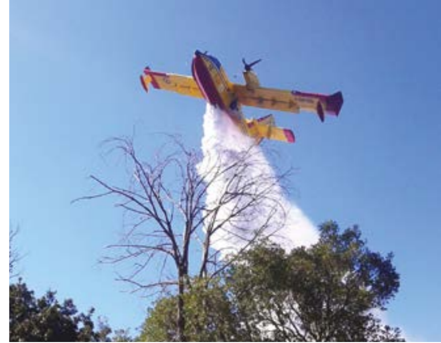
CANADAIR IN AZIONE

re una voce sola, un corpo solo, un intento unico. Respingiamo in ogni modo questo attacco, difendiamo il nostro territorio, collaboriamo con le forze dell'ordine per individuare questi bastardi. L'Ortica lo ha scritto dopo la bomba molotov lanciata contro la casa del sindaco di Cerveteri e lo ribadisce in questi momenti nei quali Ladispoli sta bruciando: non permetteremo a nessuno di trasformare il nostro litorale in un campo di battaglia. Una posizione netta espressa anche dall'amministrazione comunale di Ladispoli che, appena insediata, si è trovata a fronteggiare una emergenza dopo l'altra, arrivando fino all'attentato incendiario.