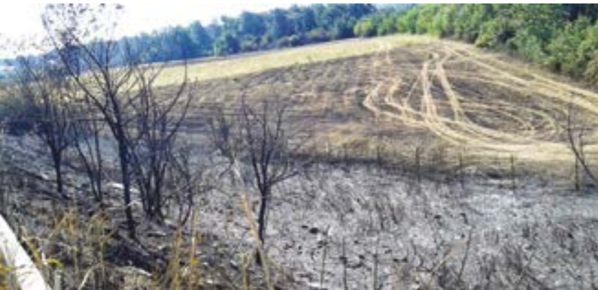
ENTRATA SUD LADISPOLI