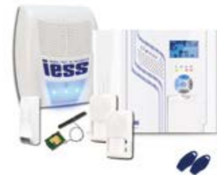
KIT IESS 1216N