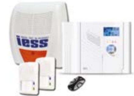
KIT IESS 1217