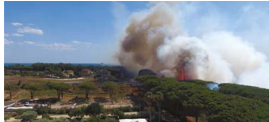
FOTO CENTRO MARE RADIO - AEREA BOSCO DI PALO