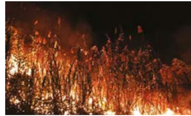
PALUDE DI TORRE FLAVIA

di colpire duro. Chiamiamolo miracolo, ma la disgrazia non è accaduta. Ma la tragica domenica del 16 luglio non la dimenticheremo facilmente. Siamo precipitati nel baratro, siamo stati pervasi dalla stessa sensazione dello scorso 6 novembre quando Ladispoli fu sconvolta da un tornado. Ferita, devastata, piegata. Solo che quel tragico giorno fu la natura a fare la voce grossa, ricordando all'uomo quanto sia piccolo e fragile. Stavolta non è stata la natura. Non è stato solo il caldo torrido. E' stata la mano di qualche bastardo che ha tentato di distruggere il nostro territorio. Non si possono innescare incendi uno dopo l'altro, del resto da giorni si parla di inneschi che sarebbero stati trovati nei pressi del bosco di Palo Laziale, Così nasce il profondo sospet-