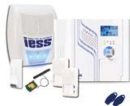
KIT IESS 1216N

Dietro un super acquisto c'è sempre un super omaggio? IESS. Ma solo con IESS.