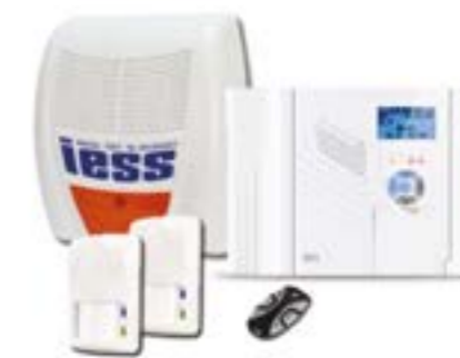
KIT IESS 1217