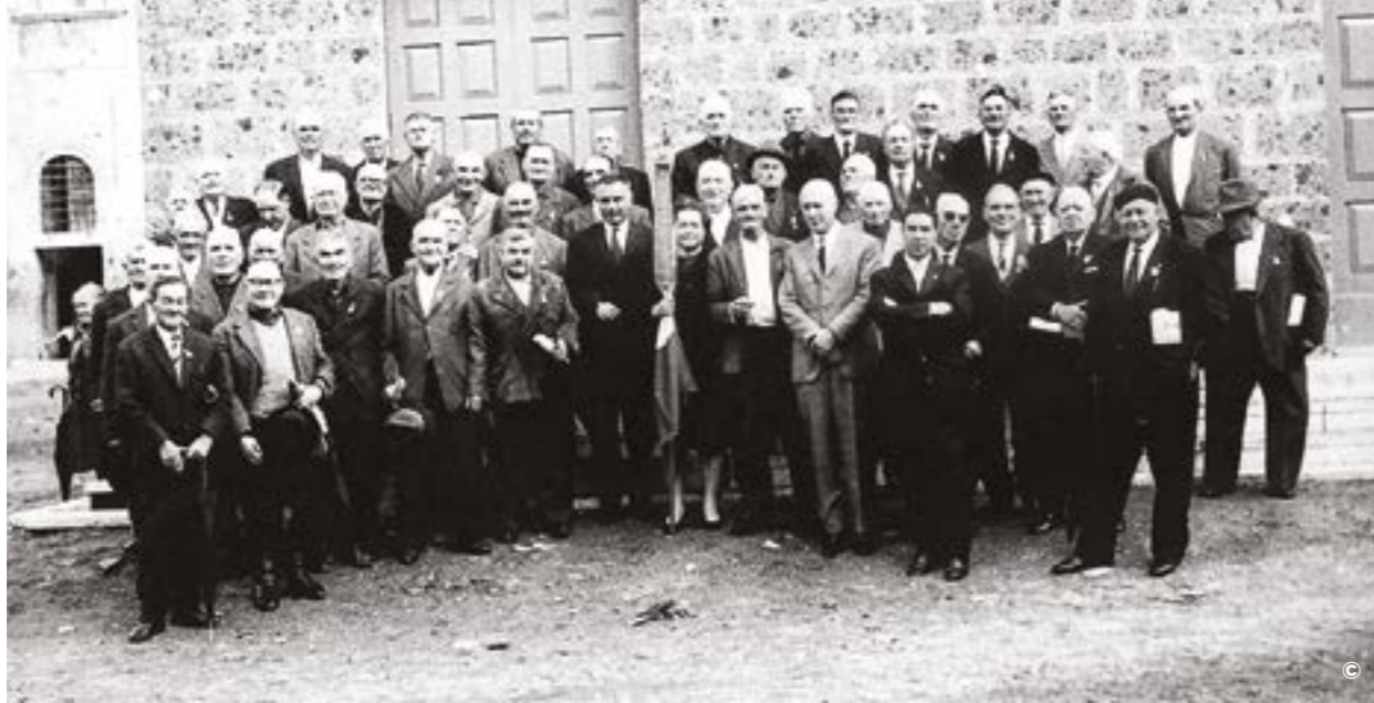
REDUCI DELLA GRANDE GUERRA