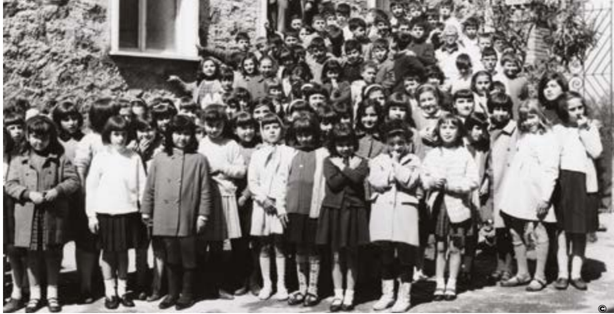
NA' PIPINARA DI RAGAZZINI