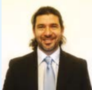
Articolo a cura del Dottor RICCARDO COCO Psicologo - Psicoterapeuta