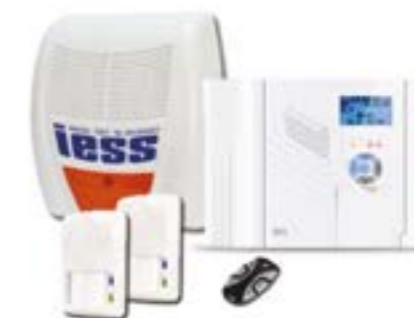
KIT IESS 1217