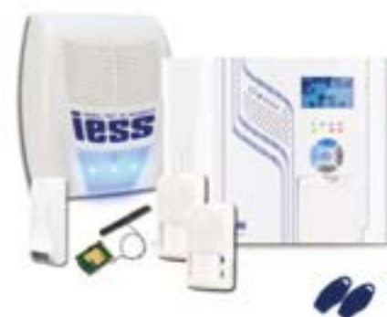
KIT IESS 1216N

Dietro un super acquisto c'è sempre un super omaggio? IESS. Ma solo con IESS.