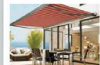
Tende da sole