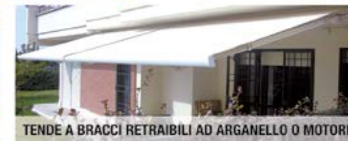
TENDE A BRACCI RETRAIBILI AD ARGANELLO O MOTORE