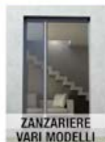
ZANZARIERE VARI MODELLI