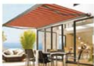
Tende da sole