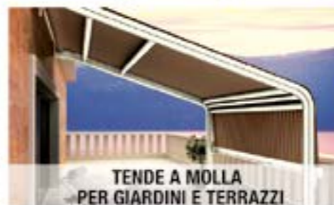
TENDE A MOLLA PER GIARDINI E TERRAZZI