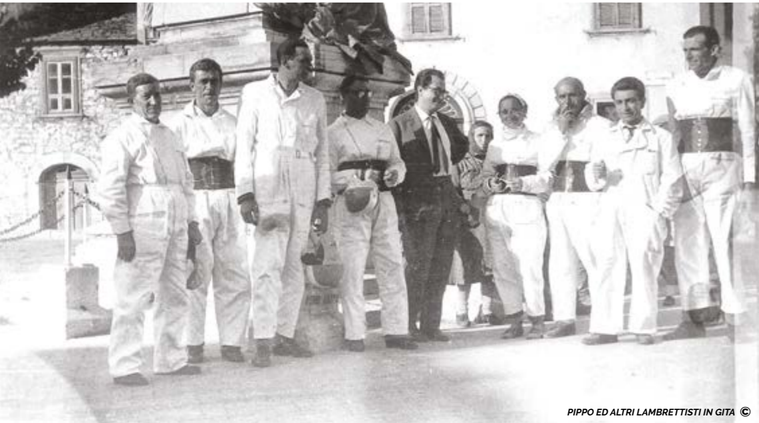
PIPPO ED ALTRI LAMBRETTISTI IN GITA ©

T erminata la guerra la schedina era SISAL e prevedeva di pronosticare dodici risultati delle partite di calcio della domenica.