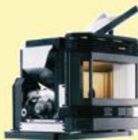
INSERTI PER CAMINO

Cerveteri - TEL 06.9953.427 - www.esigibili.it