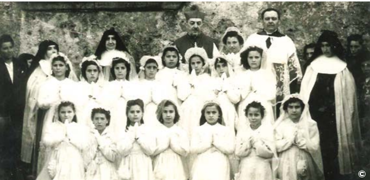
1950 IN CRESIMA