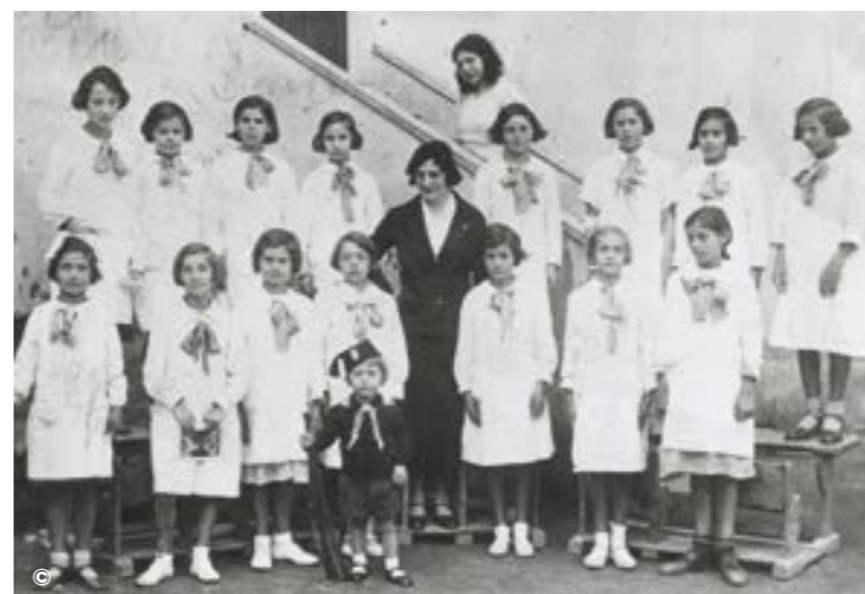
SCOLARE CON BALILLETTO