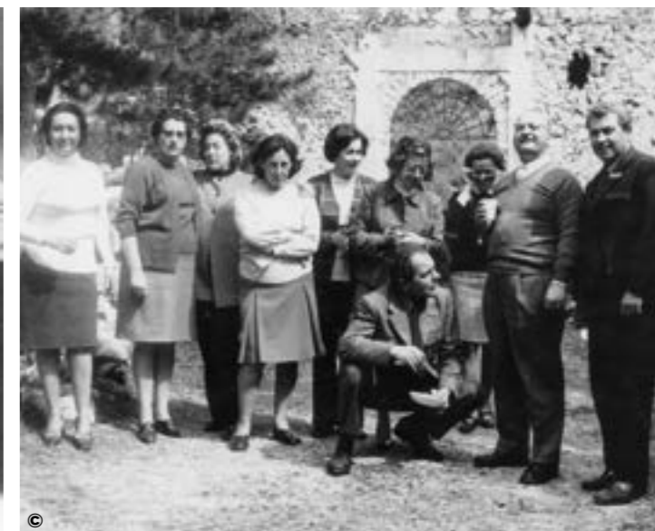
MAESTRI IN GITARELLA