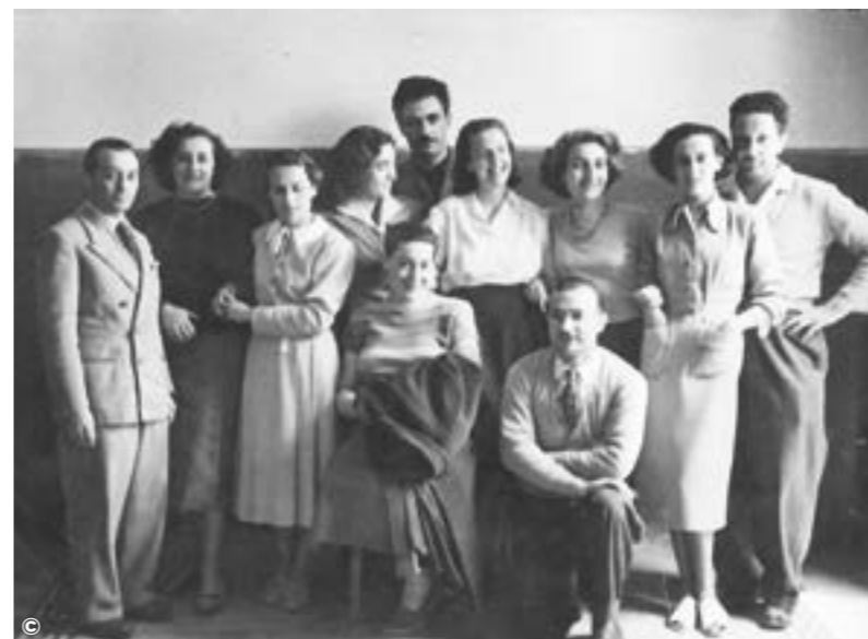
MAESTRI POST GUERRA