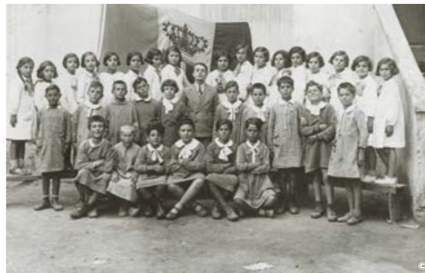
SCOLARI PRE DICHIARAZIONE DI GUERRA