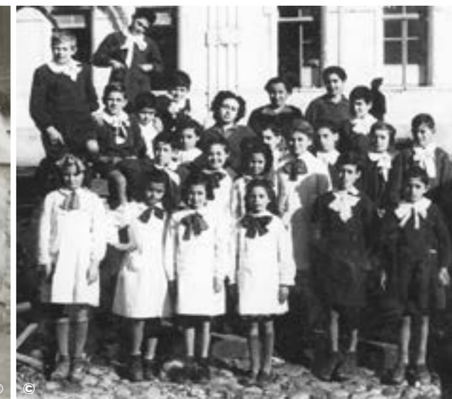
SCOLARI DEL DOPOGUERRA

I primi confetti alleati vennero lanciati sul nostro litorale nell'inoltrata primavera del quarantatre lasciando sotto il fumo macerie arrossate. La presenza dell'aeroporto di Furbara rendeva il territorio cervetrano obiettivo speciale al punto che le Autorità comunali si convinsero a chiudere la Scuola la prima domenica dopo la festa dell'ottomaggio. Tutti a casa, tutti promossi.