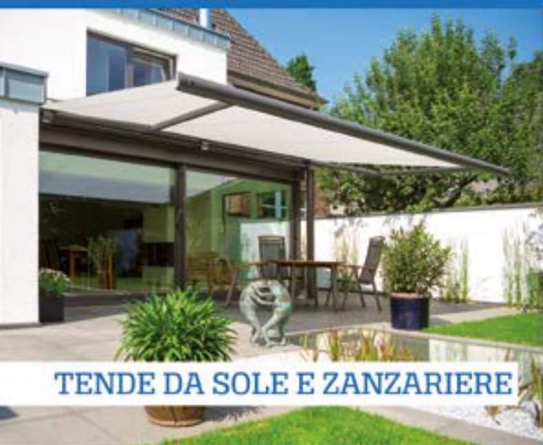
TENDE DA SOLE E ZANZARIERE