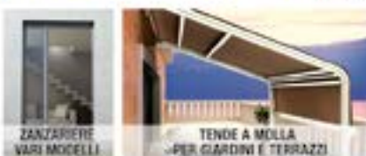
ZANZARIERE VARI MODELLI

CHIAMA SUBITO Sopralluogo e Preventivo GRATUITO 338 4356815 333 9106933 LADISPOLI