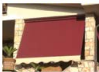
TENDE DA BALCONE