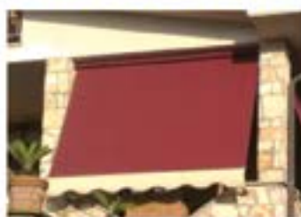
TENDE DA BALCONE