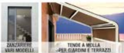
ZANZARIERE VARI MODELLI

CHIAMA SUBITO Sopralluogo e Preventivo GRATUITO 338 4356815 333 9106933 LADISPOLI