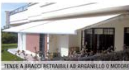
TENDE A BRACCI RETRAIBILI AD ARGANELLO O MOTORE