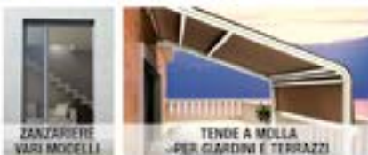
ZANZARIERE VARI MODELLI TENDE A MOLLA PER GIARDINI E TERRAZZI

CHIAMA SUBITO Sopralluogo e Preventivo GRATUITO 338 4356815 333 9106933 LADISPOLI