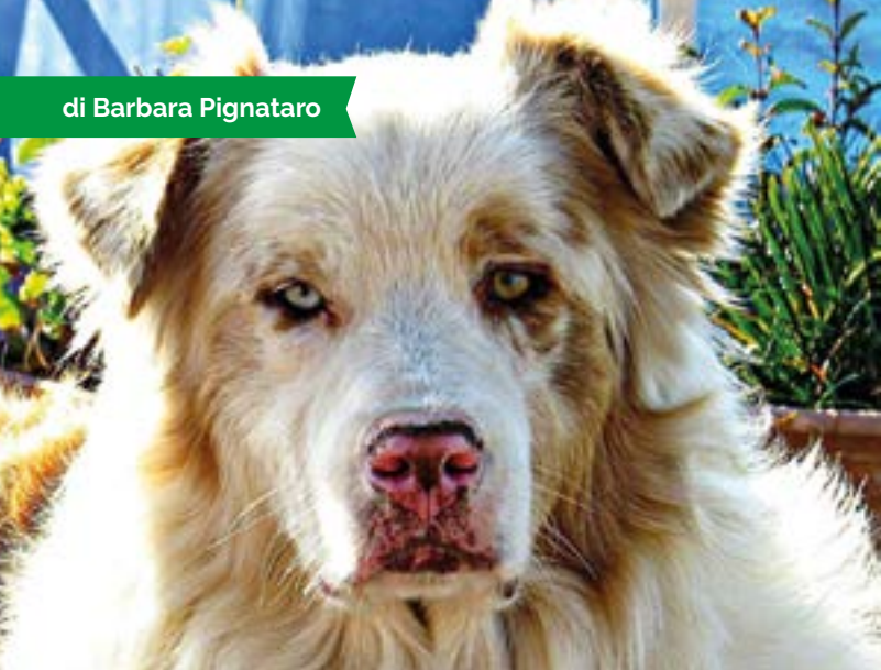
Lobo, scomparso a Civitavecchia il 21/11/2017