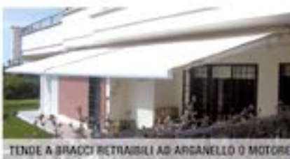
TENDE A BRACCI RETRAIBILI AD ARGANELLO O MOTORE