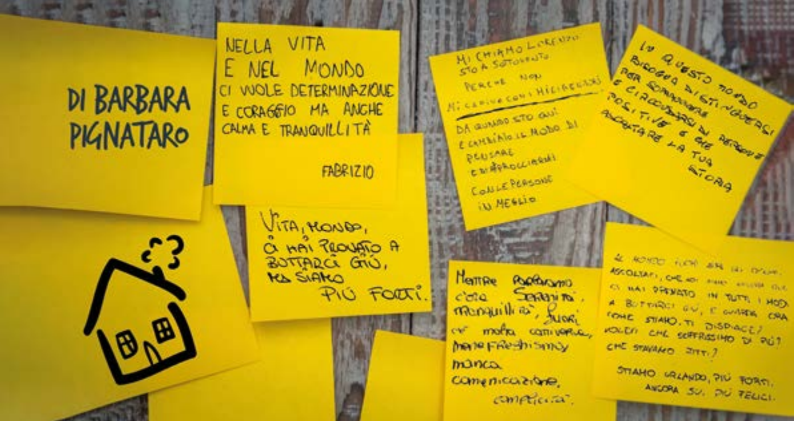
In foto i messaggi dei ragazzi