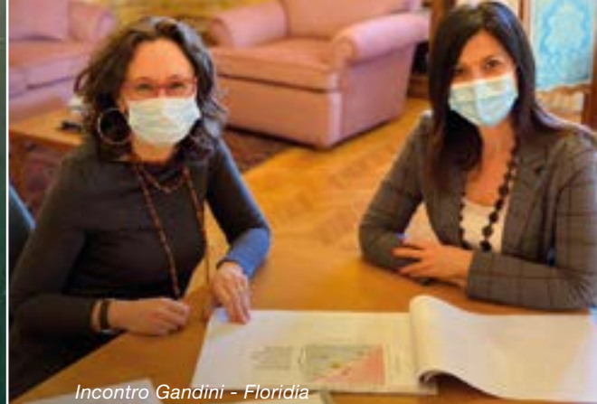
Incontro Gandini - Florida