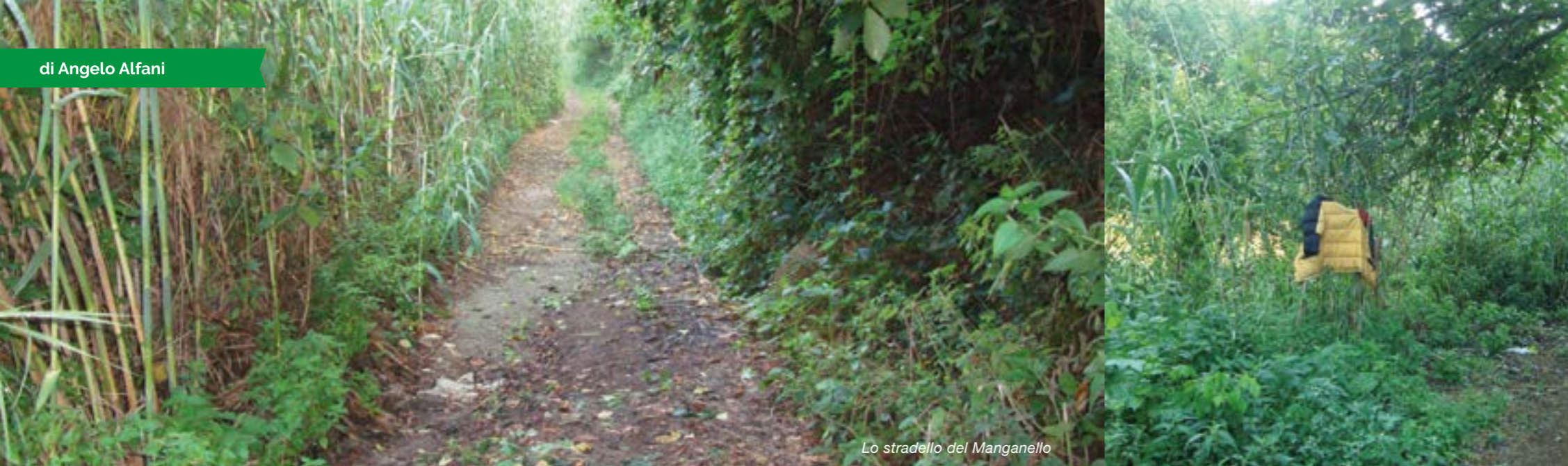
Lo stradello del Manganello