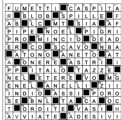
La soluzione dello scorso numero