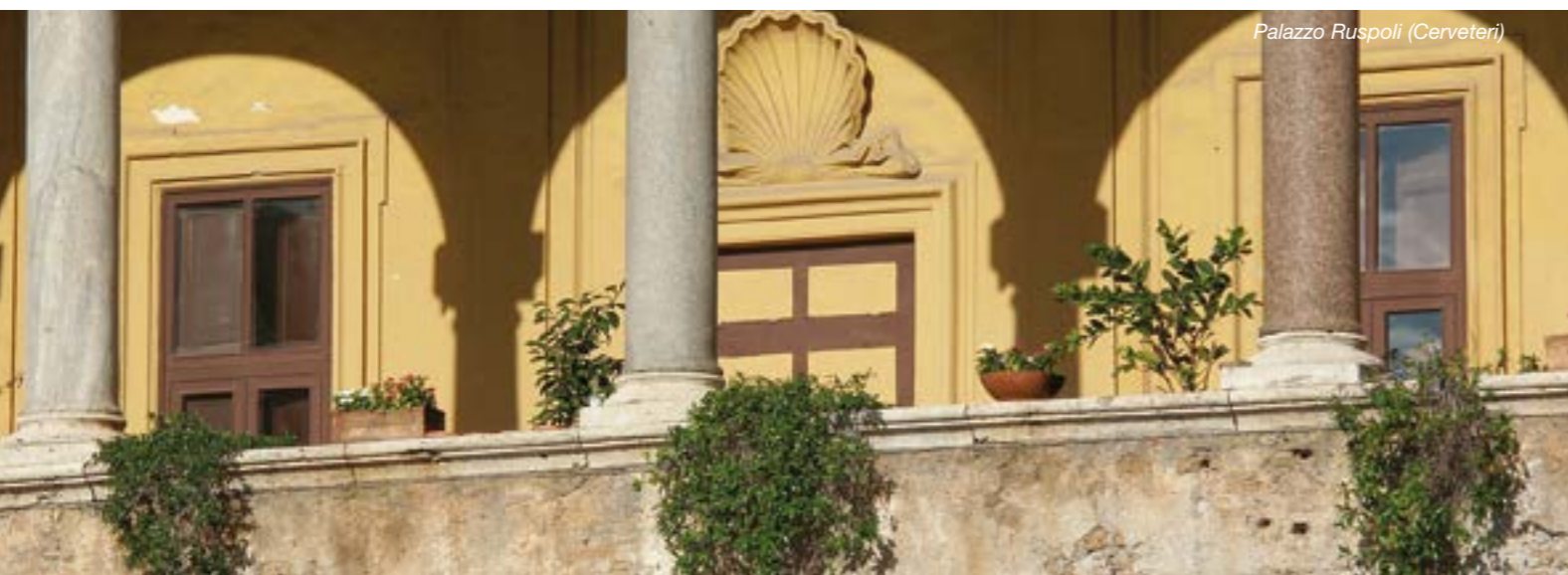
Palazzo Ruspoli (Cerveteri)