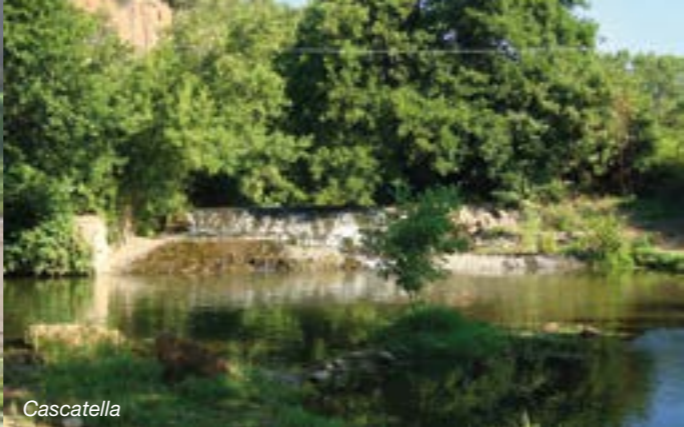
Stradello della Palma Cascatella