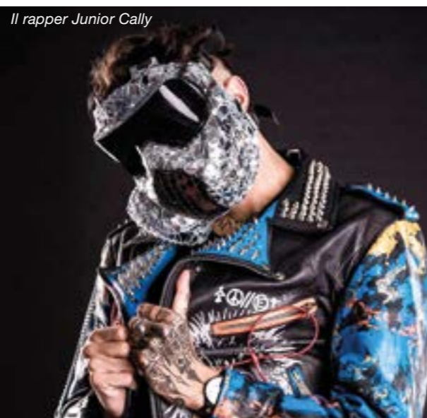
Il rapper Junior Cally