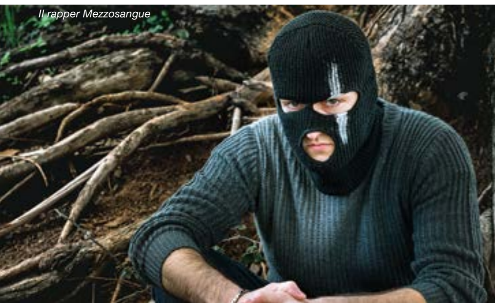
Il rapper Mezzosangue

Cosa spinge questi giovani a raccontarsi da dietro una maschera? Forse la possibilità, come dice Myss Keta, di "dare voce a dei pensieri che appartengono a tante persone", oppure poter dire cose che a volto scoperto non se ne avrebbe il coraggio: