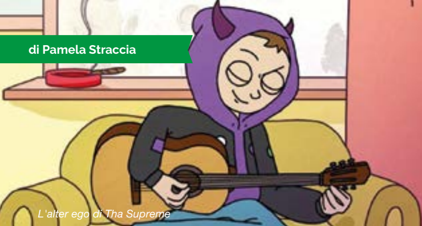
L'alter ego di Tha Supreme