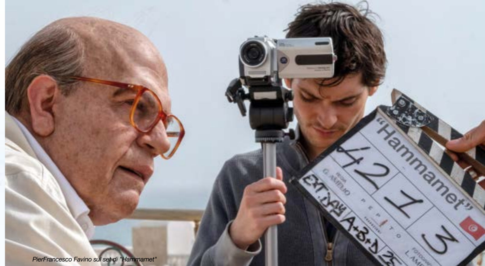
PierFrancesco Favino sul set di "Hammamet"