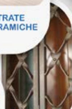
LAVORAZIONI IN FERRO (Persiane, grate, combinato, ecc)