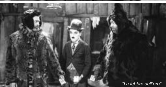
"La febbre dell'oro"

Vittorio De Seta dedicati all'Italia rurale della seconda metà degli anni Cinquanta, alla Grande Mela degli anni Sessanta raccontata da Gideon Bachmann nel suo Underground New York . E per i cinefili più appassionati c'è una vera chicca, un omaggio al cinema che festeggia i suoi 125 anni con un film che raccoglie le opere dei geni che lo inventarono, i fratelli Lumière, scelte da Thierry Frémaux, direttore dell'Institut Lumière di Lione e del Festival di Cannes, e restaurate dal laboratorio L'Immagine Ritrovata. Lumière! propone 114 corti di 50 secondi ciascuno, selezionati nell'immenso catalogo Lumière di oltre 1.400 pellicole, realizzati dagli inventori del cinematografo e dai loro operatori tra il 1895 e il 1905. Non sono soltanto le prime immagini in movimento che ritraggono il mondo, ma ce ne consegnano una visione straordinariamente potente e bella , commenta Farinelli. Questi film, fin dal primo, la Sortie d'usine, prosegue, hanno una consapevolezza dell'inquadratura che è assoluta e che si mantiene tale in ogni ripresa. Con Lumière! sarà possibile andare al di là del celeberrimo arrivo del treno al binario della stazione di La Ciotat, e scoprire che dietro a queste brevissime "vedute", c'era già un'idea che avrebbe cambiato il mondo: il cinema.