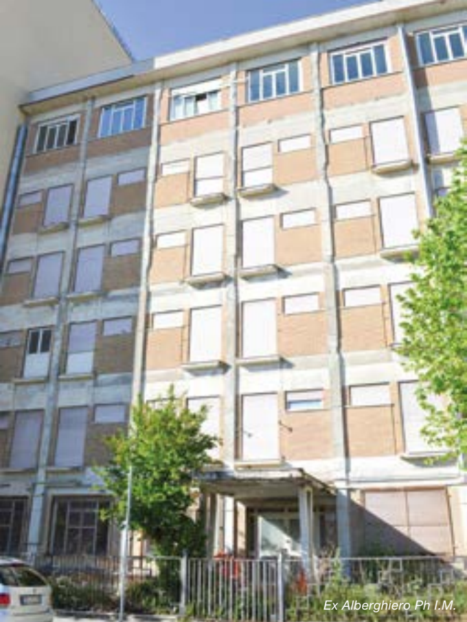
Ex Alberghiero Ph I.M.

abbiano i requisiti previsti dalla legge. Dall'insediamento dell'amministrazione sono stati già sgomberati quattro appartamenti dove risiedevano persone prive dei requisiti.