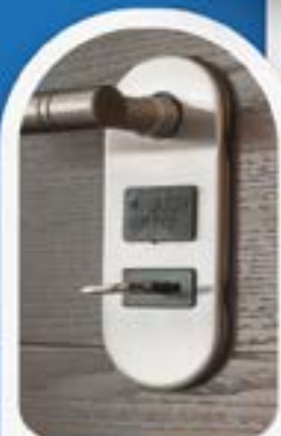
SERRATURE E PORTE BLINDATE