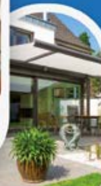
TENDE DA SOLE ZANZARIERE DI OGNI TIPO

SERRAMENTI IN PVC ED ALLUMINIO DI NOSTRA PRODUZIONE.