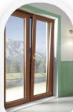
FINESTRE IN PVC ED ALLUMINIO